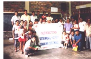
Curso sobre gestión empresarial