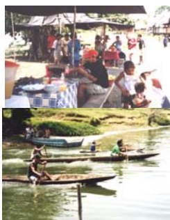
Tour al Lago Pucuna