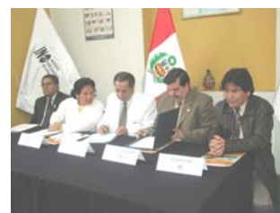
Firma de Convenio entre Caritas del Perú y el Instituto de Oftalmología - INO

destinado a mejorar las condiciones de vida de los sectores más necesitados otorgándoles una atención oftalmológica especializada.