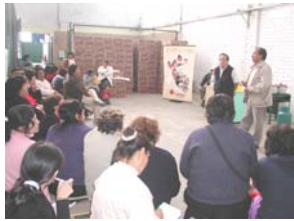
Reunión con señoras de comedores populares del Callao