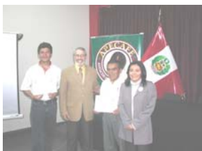
Premiación a la Asociación de Productores Agropecuario

El 17 de agosto se llevó a cabo la premiación de los cafés ganadores de la Academia de Cafeología de la Asociación "Caffée Procope" de París en la Asociación de Exportadores – ADEX. La Asociación de Productores Agropecuarios, La Flor de Miraflores de Jaén, quien resultó ganadora del premio Grandes Crudos, recibe asistencia técnica de Caritas Jaén - Programa PODERES – USAID.