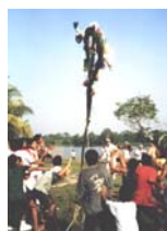
Tour al Lago Cuipari