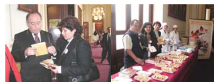
Degustación en el Congreso