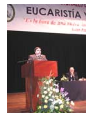
IV Jornadas Internacionales de Caridad y Voluntariado

El Presidente del Consejo Pontificio Cor Unum, Mons. Josef Cordes, quien vino a participar en el evento de caridad y voluntariado, visitó la oficina central de Cáritas y se reunió con el personal, alentándolo a continuar con el trabajo al servicio de los más pobres del país.