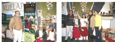
Feria Turística PROMPERU 2005