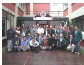
Participantes del evento

Además de las Cáritas de la región, participaron CRS y el Departamento de Cooperación de Caritas Internationalis.