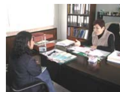
Entrevista a gerente de Microfinanzas