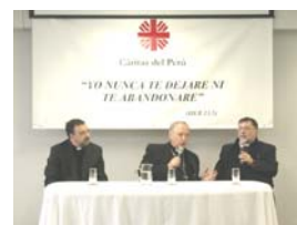
Visita de Monseñor Cordes a la oficina central de Cáritas del Perú

El Presidente del Consejo Pontificio Cor Unum, Mons. Josef Cordes, quien vino a participar en el evento de caridad y voluntariado, visitó la oficina central de Cáritas y se reunió con el personal, alentándolo a continuar con el trabajo al servicio de los más pobres del país.