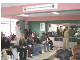
Visitas de participantes del evento a la oficina central

El evento tuvo 3 momentos: (1) Encuentro de directores nacionales de las 22 Cáritas Nacionales de América Latina y el Caribe. (2) Encuentro de Cooperación y Emergencia. (3) Taller de entrenamiento en prevención y atención de emergencia.