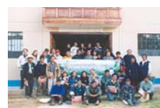
Taller "Recursos para el Desarrollo y Prevención de Desastre"