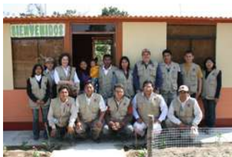
Equipo de Cáritas Chincha