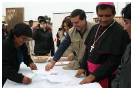
Entrega de viviendas en Grocio Prado - Chincha