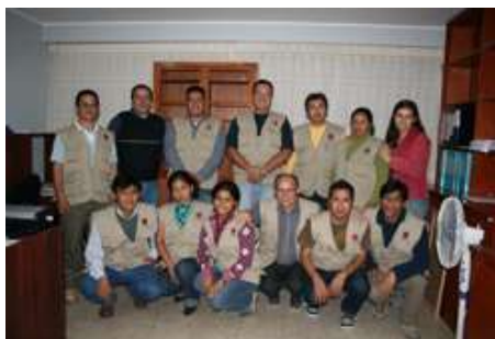
Equipo de Cáritas Ica