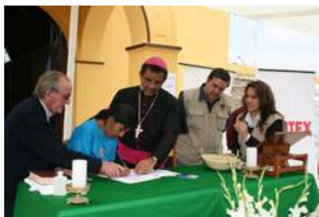
Beneficiaria recibiendo su nueva casa en Alto Larán - Chincha

Los pobladores de estos 4 distritos agradecieron a Cáritas por haberles brindado no sólo los materiales para la construcción de sus viviendas sino también la dirección técnica adecuada. Cabe señalar que cada familia participó activamente en la construcción de sus viviendas con mano de obra.