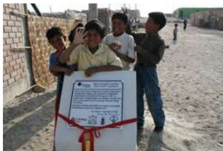
Niños beneficiarios de las nuevas viviendas en San Clemente - Pisco