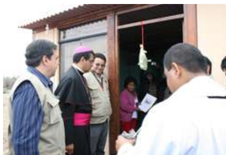
Inauguración de viviendas en Grocio Prado - Chincha