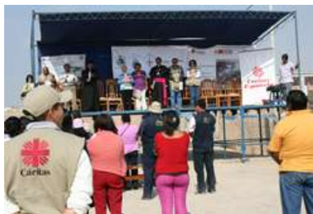
Estrado de honor en San Clemente - Pisco